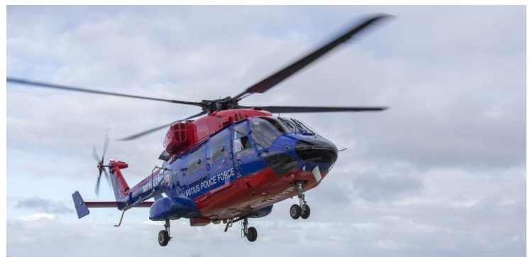
Approche de l'hélicoptère pour l'évacuation médicale

N'hésitez pas à m'envoyer vos idées remarques ou questions sur le travail à bord ou les échanges que l'on pourrait avoir à mon retour : conférences, élaboration d'exercices, de TP, liens lycée - universités, contacts en Europe. L'aventure se prolongera après le 30 janvier !