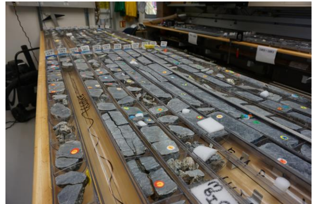
Les autocollants nominatifs sur les demi-carottes de travail pour réserver un échantillon

Du 1 au 3 janvier, nous avons fait route vers Maurice en traversant une tempête. Le 3 janvier, l'hélicoptère est venu à notre rencontre et après un parfait atterrissage, l'évacuation médicale a pu avoir lieu très efficacement. Nous faisons route maintenant vers notre site de forage. Sur place, le nettoyage du puits doit avoir lieu et ne sera pas une mince affaire.