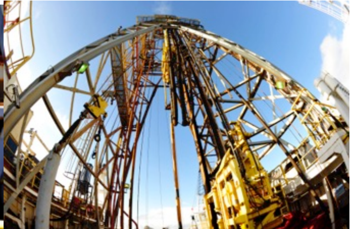
Le derrick vu par notre reporter chinoise Jiansong Zhang

Un superbe barbecue le dimanche nous a permis de fêter dignement la première carotte et d'échanger les congratulations, les souhaits de réussite, les impressions de vivre une belle aventure !