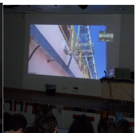
Le derrick fait irruption en classe