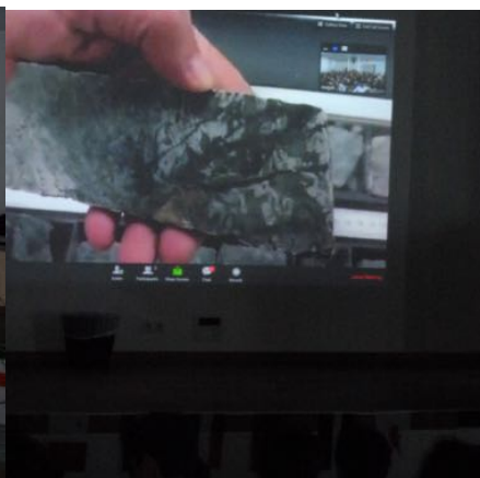
Attention, Gabbro géant !